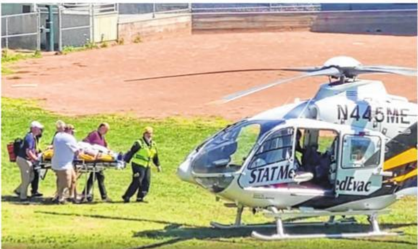
Author Salman Rushdie being taken on a stretcher to a helicopter for transport to a hospital after he was attacked during a lecture at the Chautauqua Institution in New York, on Friday